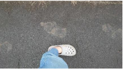
↑ 道路に残るクマの足跡