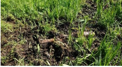
↑ イノシシによる掘り起こし