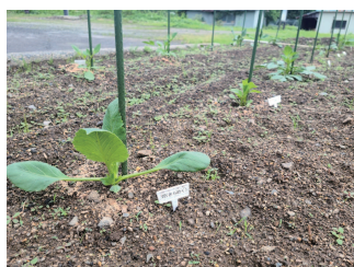
暑い中での作業、 ありがとうございます