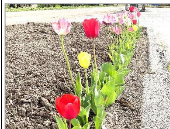
4月末の四方山館花壇(チューリップがきれいです。)

連休前の四方山館花壇の縁にチューリップがいっぱい! 今年の花壇は子ども教室とコラボで野菜作りに挑戦です! 里芋等を作り、子ども教室の芋煮会で、自分達で作った野菜を食べることを計画中です。花壇(畑)作りにご協力頂ける方、ご連絡頂ければと思います。