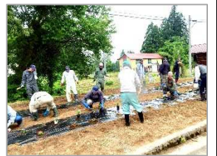
御伊勢町の花植えの様子

6月7日(日)玉庭地区花いっぱい運動が行われました。マリーゴールド、ペコニア、日々草をお配りし、各自治会で花壇に植えて頂きました。玉庭が、皆さんに植えて頂いた花でいっぱいになります。ご協力頂いたみなさん、ありがとうございました。