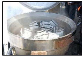
YUKIMATSURIで非常食を回転鍋で湯煎