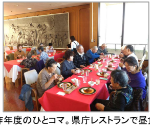
昨年度のひとコマ。県庁レストランで昼食